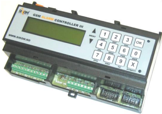
Sikom GSM AC III

- för övervakning och fjärrstyrning via GSM nätet.