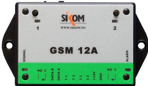
Sikom GSM 12 A